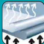
Saugfähig / Dampfaffen